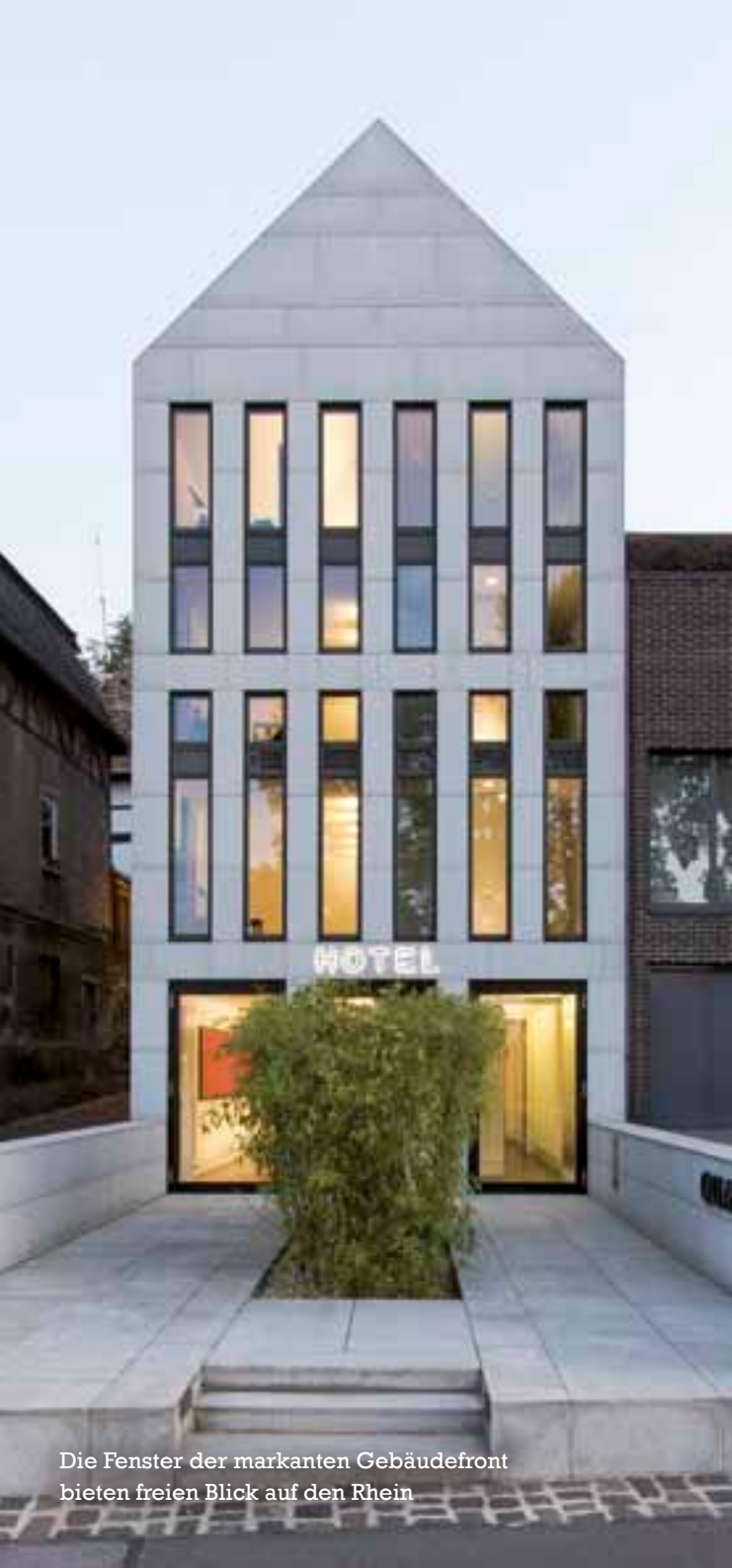
Die Fenster der markanten Gebäudefront bieten freien Blick auf den Rhein