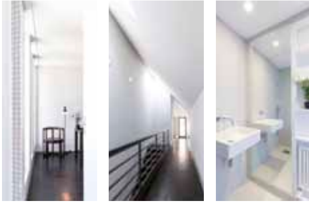
Wohneinheit im Obergeschoss.